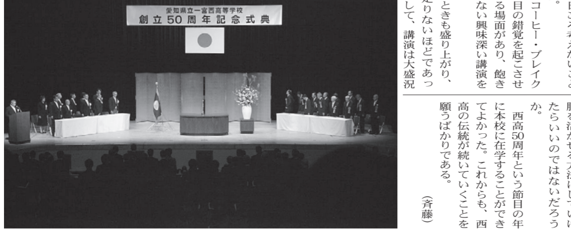
創立50周年記念式典

いえ、当時の私の勉強量は今の西高生に 比べれば全く及ばないが、英語の予習 はしっかりとやっています。小 体重計に乗っていました。引退する想 いを絶つ増え方を止まらなかつたから です。今では考えられないのですが、一 字一句「綺麗に」訳そうと、「綺麗に」 ノートを作っていました。その せいで大学に入ってから苦労するのだ が、そのノートのおかげで、昔から英語 を習っていたおかげで、英語はまず できるようになりましたし、好きな教科 に、みんな弱気なところを仲間に見せ ていた時、兄が言いました。