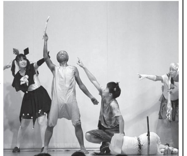
3-8 Monsters Link Heroes

本来であれば、体育祭の後 に文化祭を迎えるはずの西高 祭。しかし、今年はいよいよ 天候に恵まれず、体育祭は延 期となってしまっ。今回 の記事は、皆様にも臨場感 味わっていただくため、新聞 として異例ではあるが、演出 の都合上あえて現在形で書い てあるところもある。当時の 記憶に自分を置いて読んでい ただければ幸いです。