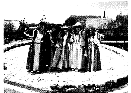
1年遠足（リトルワールド）

私は8回生で現在56歳になります。もう十数年も年末に同級生の忘年会兼プチ同窓会をしております。卒業アルバムを見ると、あの頃の思い出が走馬灯のように蘇ってきます。毎年同じような話ばかりしてますが：（笑） でも歳を重ねる毎に話題も変わってきました。最近では仕事、定年、年金、健康の話題が中心になってきました。子供はほとんど成人して、早い人ではお爺さんお婆さんと呼ばれている人もいます。本人はまだまだ若いつもりなのですが：