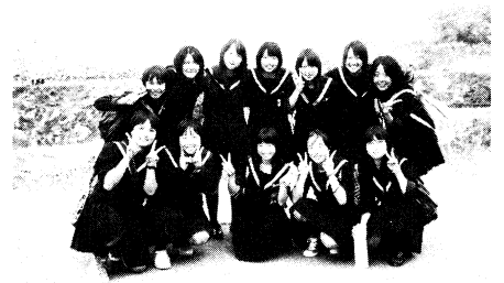
修学旅行・秋吉台